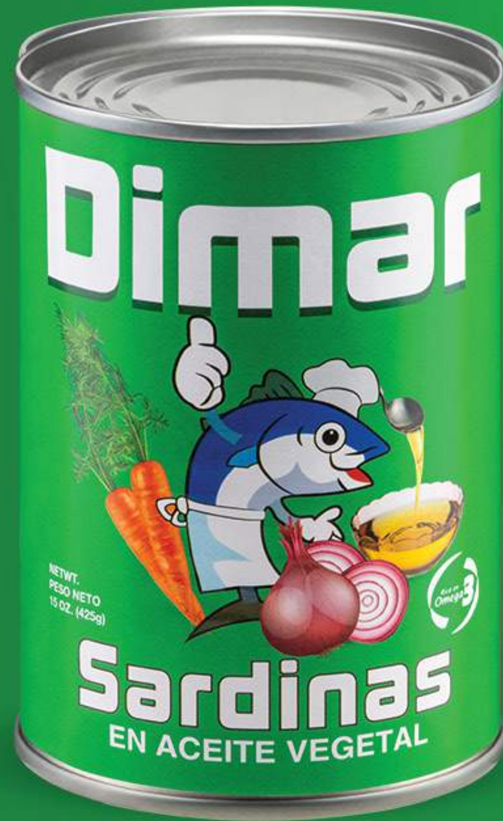
Caja 24/425 gr (15oz)