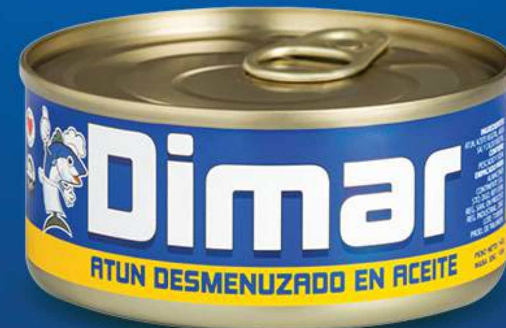
Caja 48/142 gr (5oz)