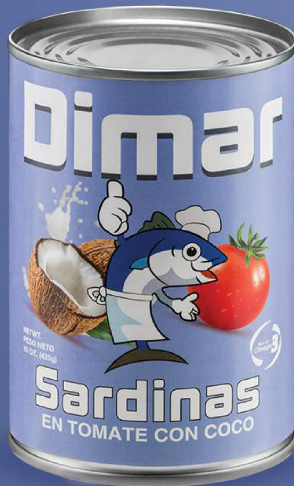
Caja 24/425 gr (15oz)