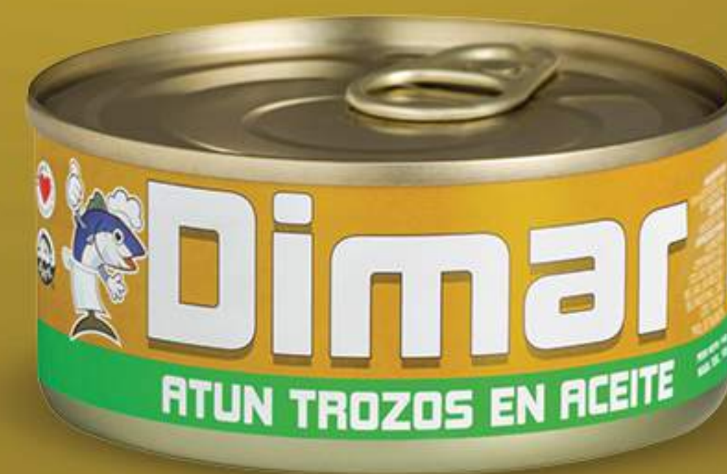
Caja 48/142 gr (5oz)