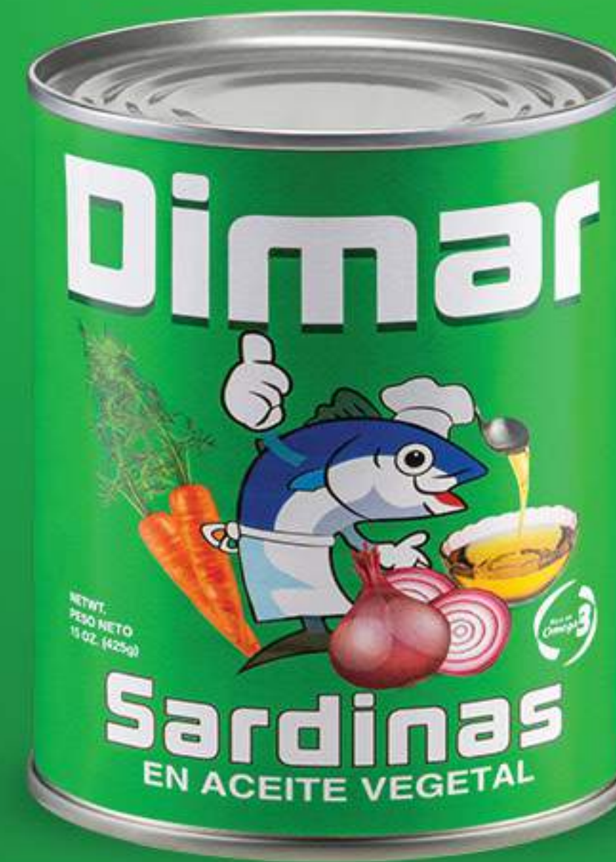
Caja 48/225 gr (8oz)