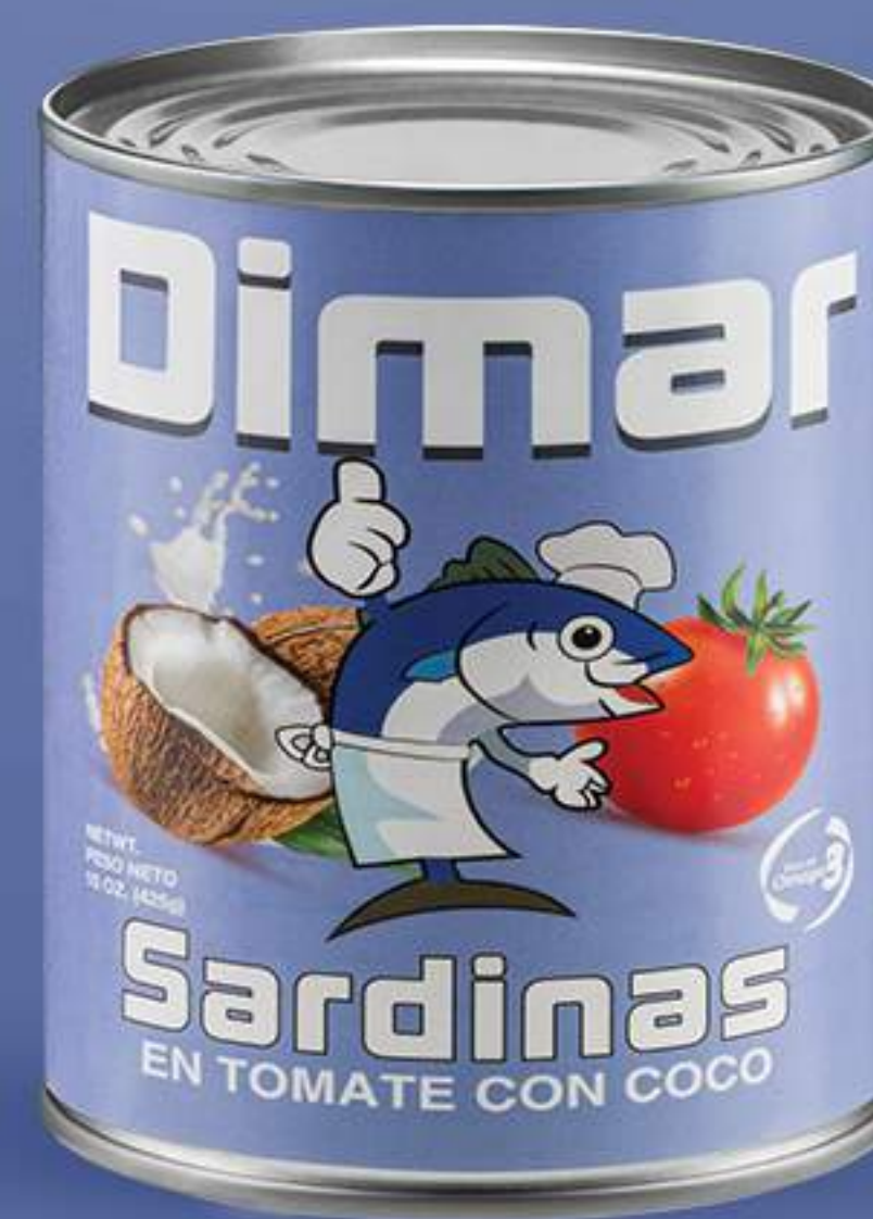
Caja 48/225 gr (8oz)