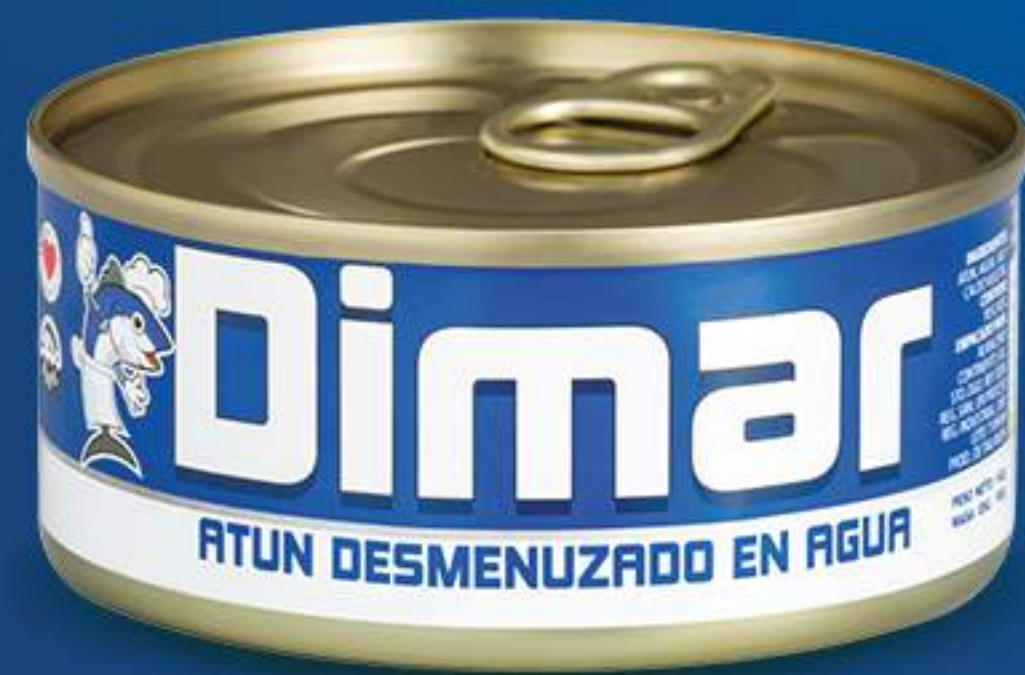
Caja 48/142 gr (5oz)