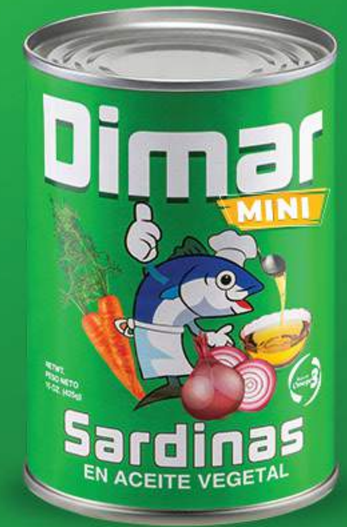
Caja 50/155 gr (5.46oz)