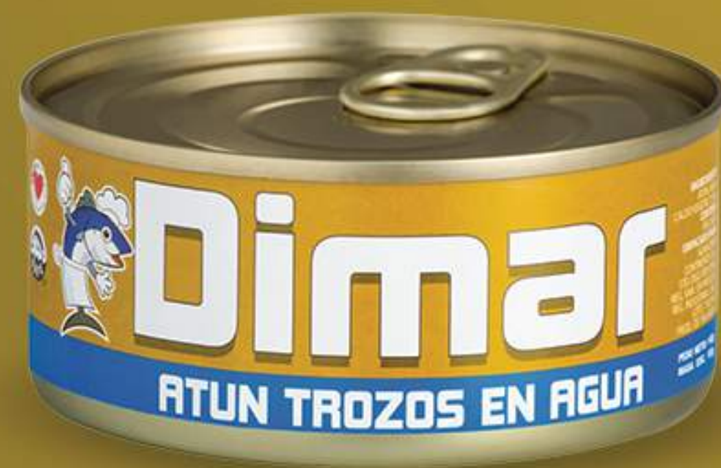
Caja 48/142 gr (5oz)